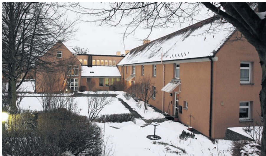
Das Tagungszentrum Schmerlenbach.

Der Verbrauch an Reinigungsmitteln soll zudem um fünf Prozent gegenüber 2009 reduziert werden. Nach-